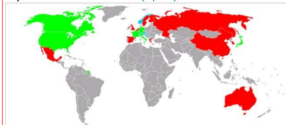
Carte des pays ayant accueilli les jeux [réf. obsolète]

25) Observe bien cette carte (1 point) :